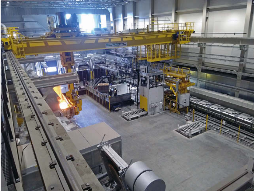
Überblick über die Schmelzabteilung in der neuen Scania-Eisengießerei.