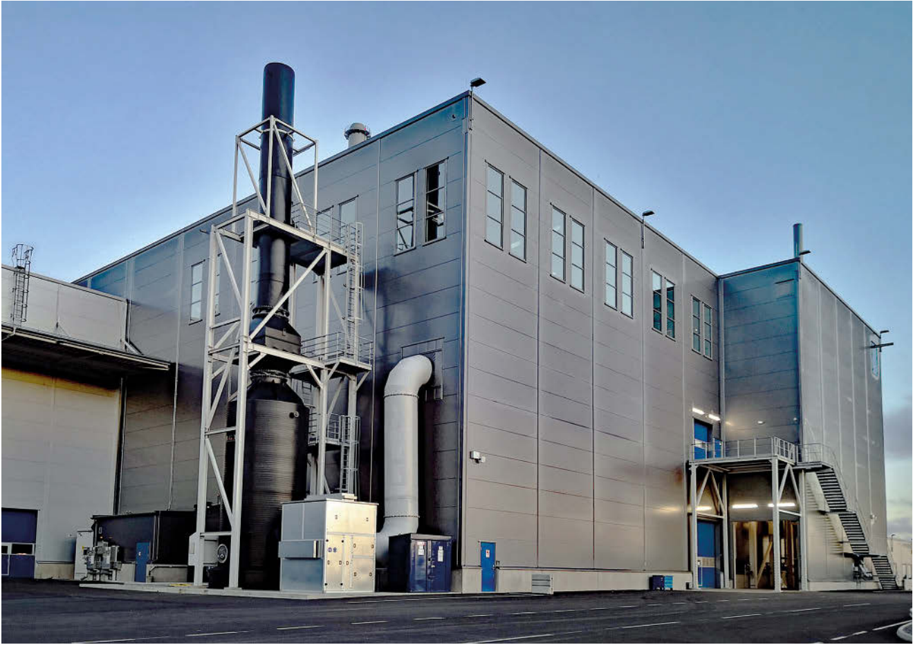
Blick von außen auf die Kernmacherei.

Ebenfalls 2017 wurde das Grundkonzept für die neue Gießerei erstellt, in dem Scania und Gemco das Hauptlayout, die Dimensionierung der Hauptausrüstung, das Budget für den Prozess, einen Projektplan und eine Kooperationsstruktur sowie einen Zeitplan zusammenstellten. Die Gemco-Ingenieure wohnten in Södertälje, um möglichst eng mit dem Scania-Team zusammenzuarbeiten.