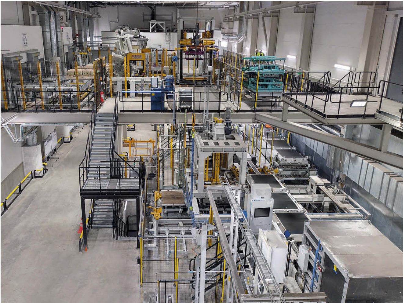
Blick auf die Formanlage in Södertälje.

wiederkehrende Diskussion statt, in der zunehmend der Wunsch nach einer Gießerei mit einem echten und außergewöhnlich hohen Maß an Nachhaltigkeit formuliert wurde. Eines der Nachhaltigkeitsziele für die neue Gießerei war beispielsweise die Verwendung von 100 Prozent erneuerbarer Energie und null CO 2 -Emissionen. Dieses Nachhaltigkeitskonzept für die neue Gießerei stand in vollem Einklang mit Scantias „Strategie für die Zukunft“.