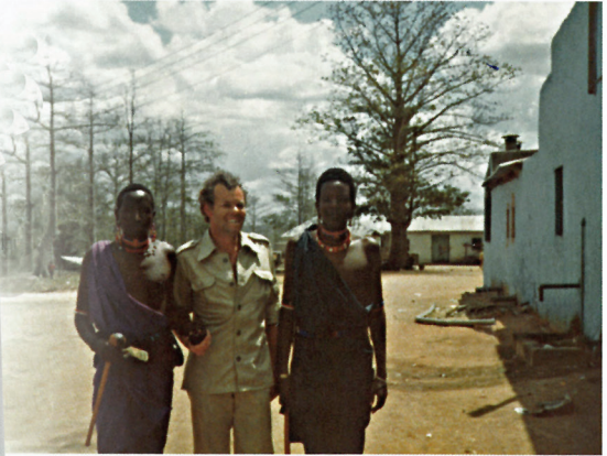
Je moet niet alleen maar werken. Af en toe ging ik in het weekend met een paar mensen de bush in om rond te kijken. Mijn metgezellen hadden een heilig respect voor deze twee Masai-krijgers en durfden mij pas na lang aandringen met hen op de foto zetten.

manufactured 200 break drums, 60 exhaust manifolds, 60 break master cylinders, 15 clutch houses and 36 liners for Ikarus Buses. Ndugu Mpore said the new foundry which produces spares mainly for Bedford, Landrovers, Peugeot, UDA mini buses and Volkswagens is highly mechanized as opposed to the old one which depended mostly on manual labour. For example, he said, 12 block engines that used to be produced in 10 days were now being manufactured in a matter of four hours. He said the old foundry which started production in 1974 is now closed down and can only be used when the new foundry is confronted with electric power problems. On training for local personnel, Ndugu Mpore said that the depot had 83 students from Chang'ombe Vocational Centre and 6 from technical secondary schools who will undergo a three year